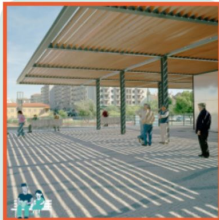
Luifel op het plein brengt verkoeling