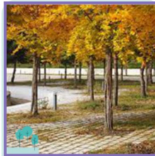
Zachte overgangen tussen plein en park