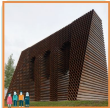
Poort als kunstwerk