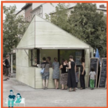
Kiosk op het plein