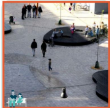
Plein met ziteilanden

De ontwerpers laten zich graag inspireren door de foto's hieronder. Welke foto's spreken jou het meest aan? Geef gerust wat uitleg. *