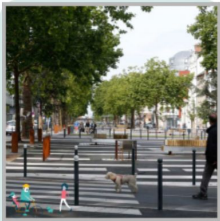
Op maat van zachte weggebruiker