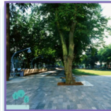
Scherpe overgang tussen plein en park