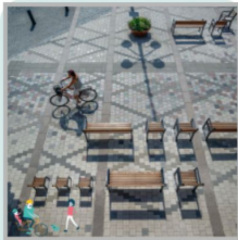
Gemengd gebruik van het poortplein